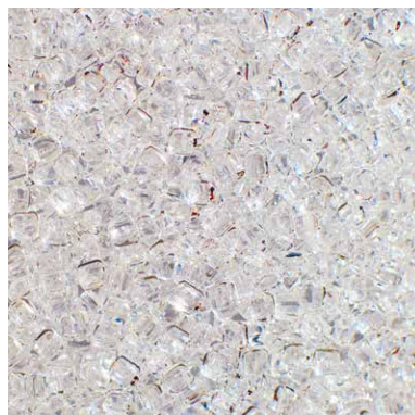
Oberflächenbeschaffenheit in Originalgröße

Damit Sie ein Leuchtmittel ganz nach Ihrem Geschmack (auch LED- oder Energiesparlampen) einsetzen können, sind alle Leuchten mit einer üblichen E27-Fassung ausgestattet.